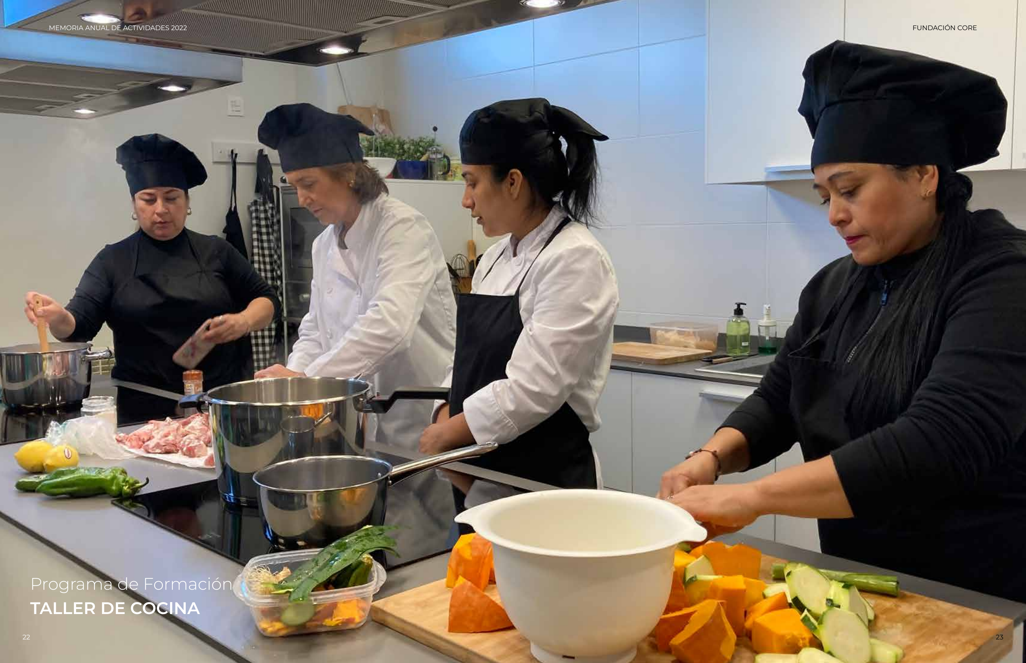
Programa de Formación TALLER DE COCINA