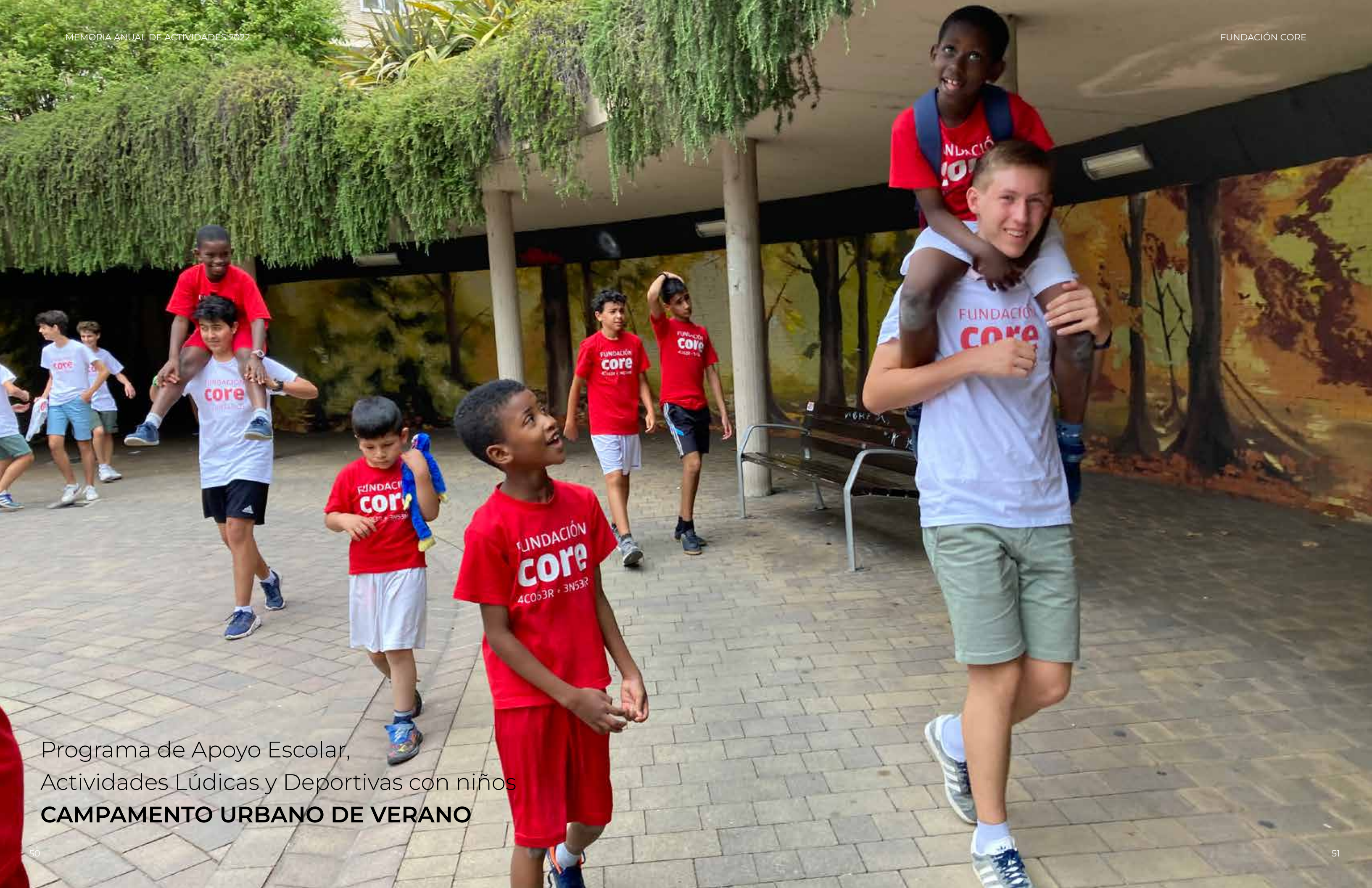
Programa de Apoyo Escolar, Actividades Lúdicas y Deportivas con niños CAMPAMENTO URBANO DE VERANO