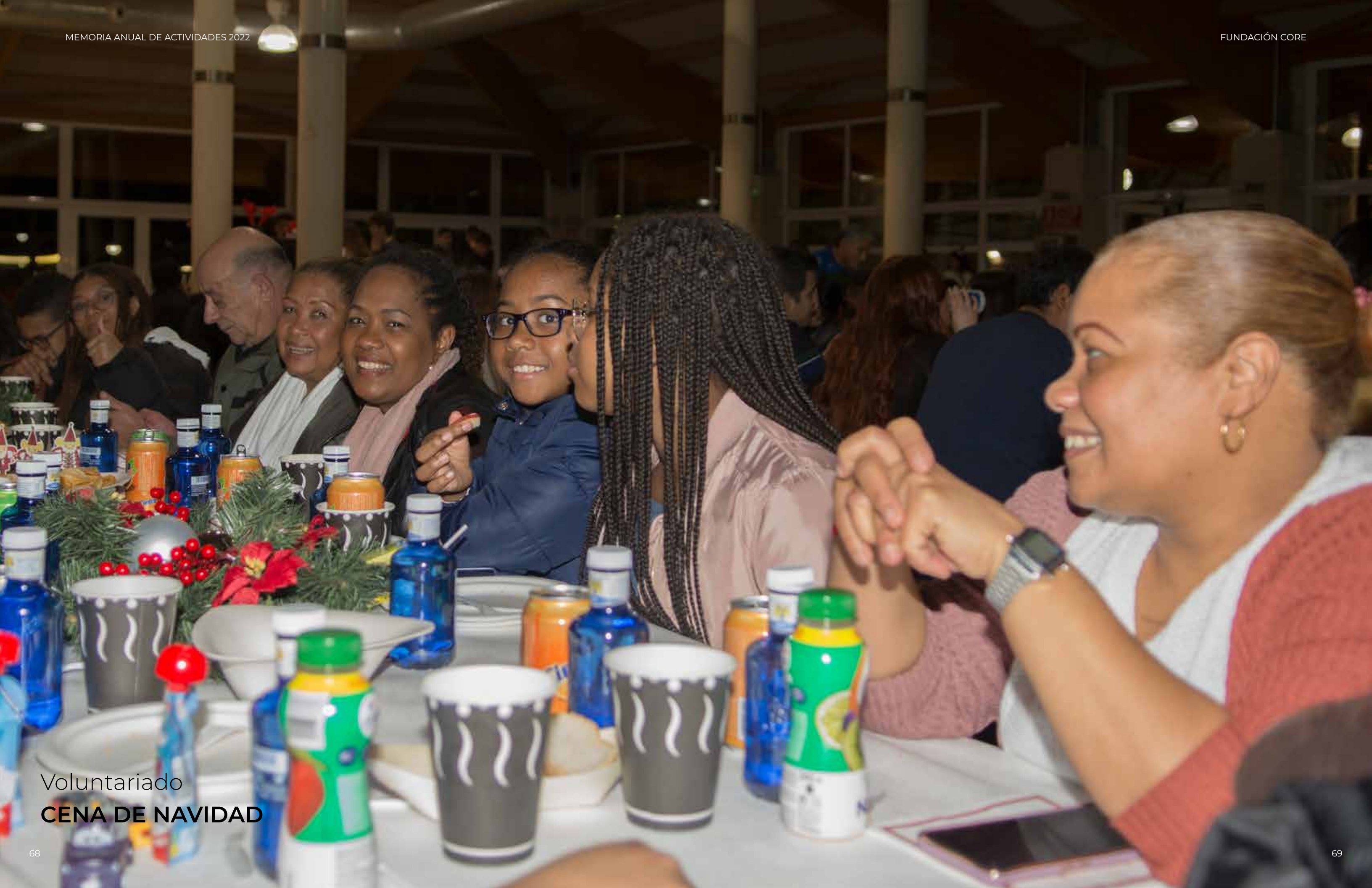
Voluntariado CENA DE NAVIDAD