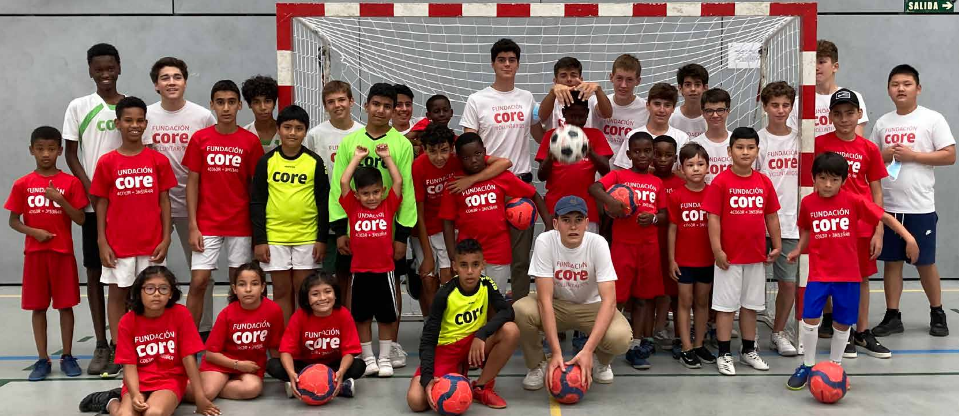
Programa de Apoyo Escolar, Actividades Lúdicas y Deportivas con niños CAMPAMENTO URBANO DE VERANO