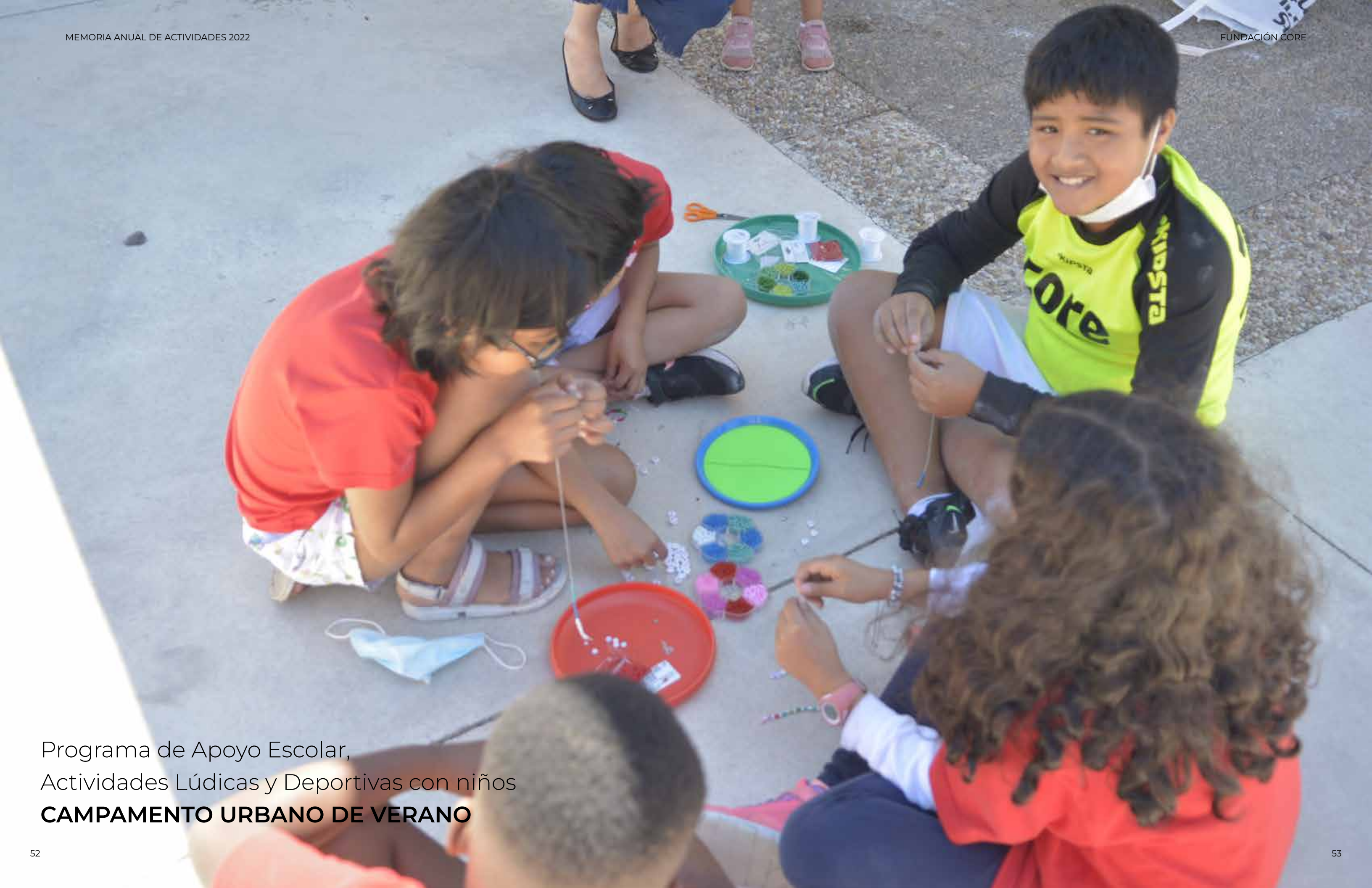
Programa de Apoyo Escolar, Actividades Lúdicas y Deportivas con niños CAMPAMENTO URBANO DE VERANO