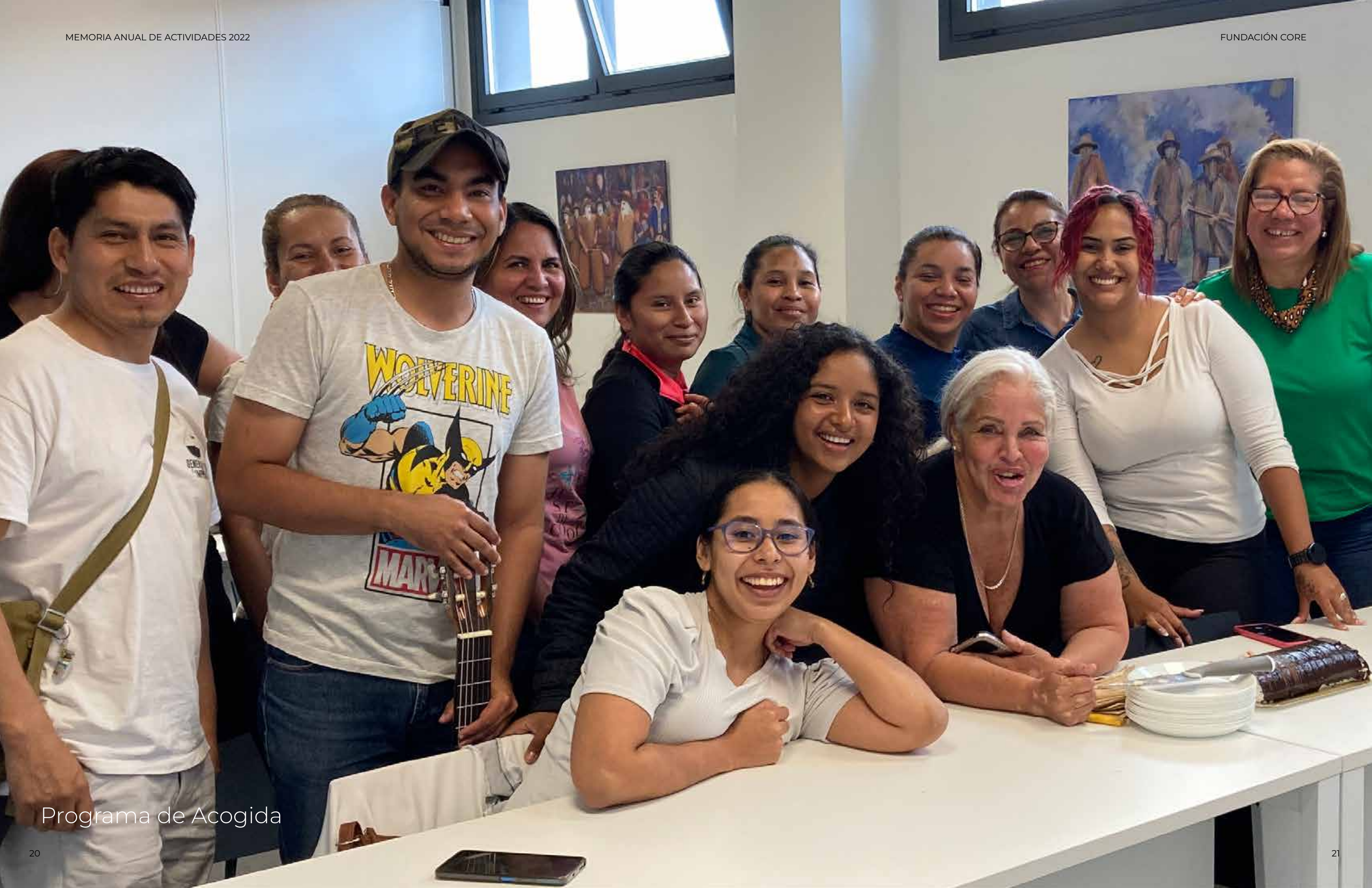
Programa de Acogida