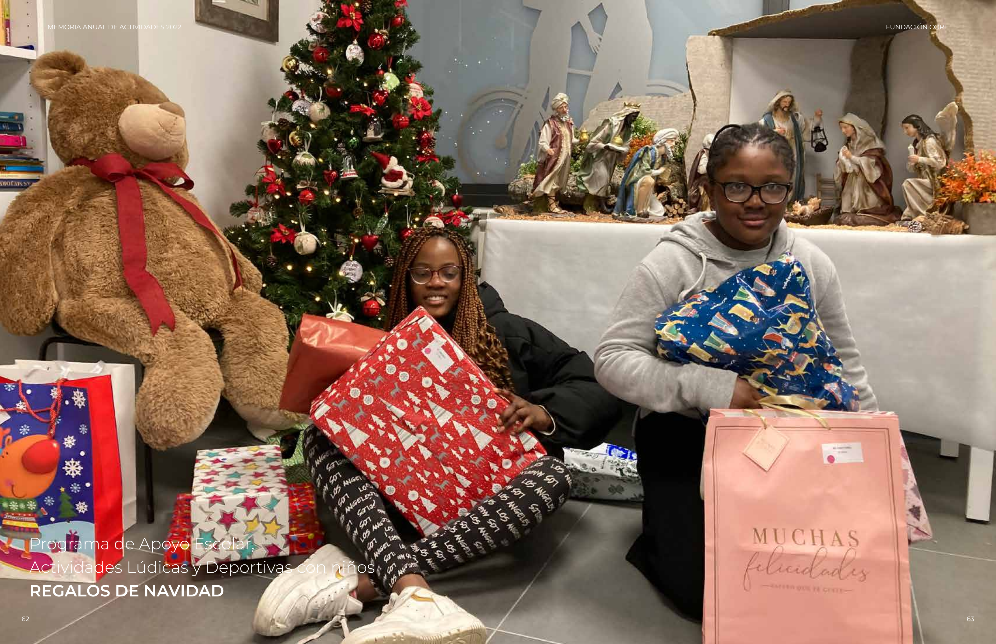
Programa de Apoyo Escolar, Actividades Lúdicas y Deportivas con niños REGALOS DE NAVIDAD