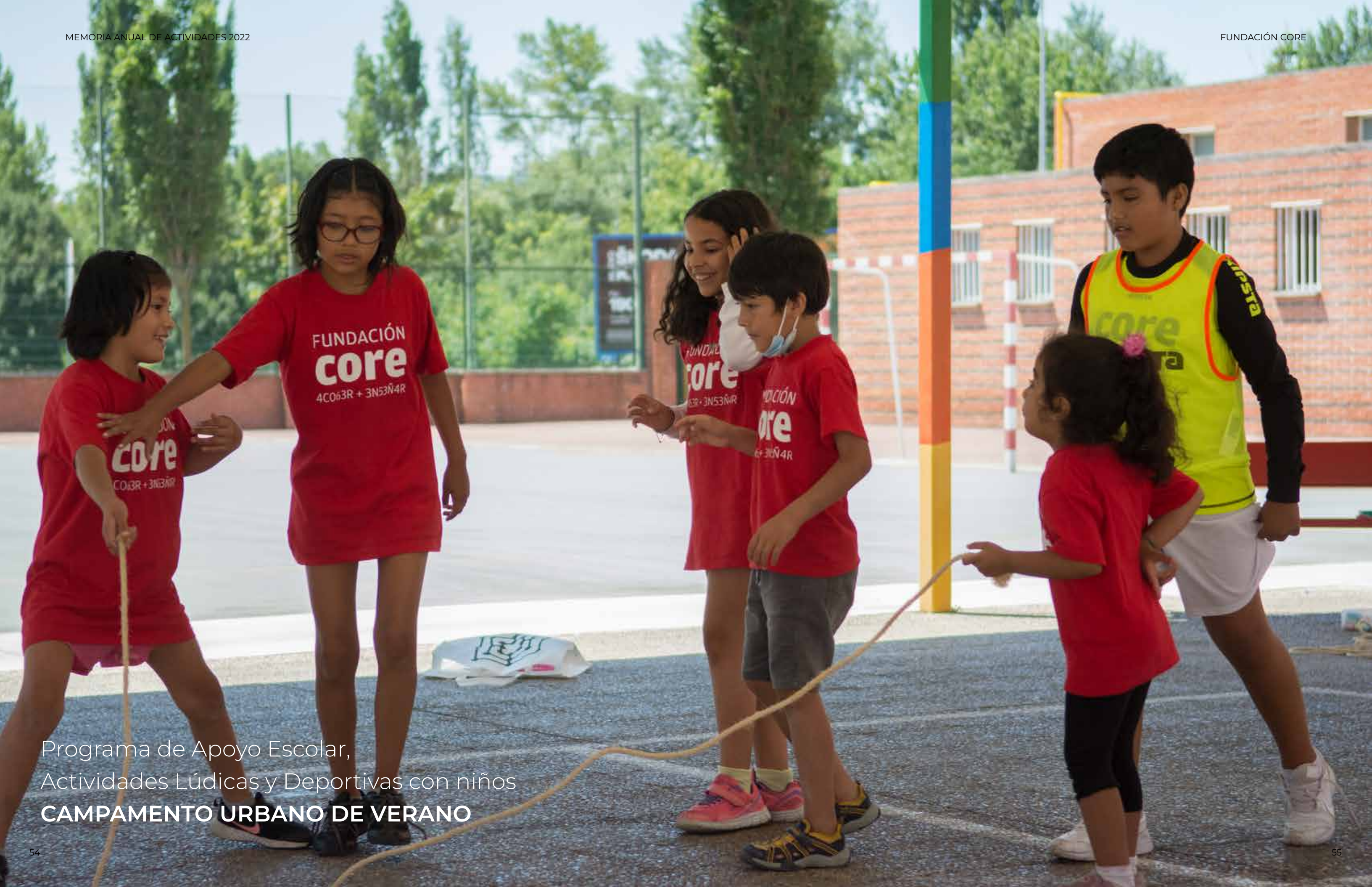
Programa de Apoyo Escolar, Actividades Lúdicas y Deportivas con niños CAMPAMENTO URBANO DE VERANO