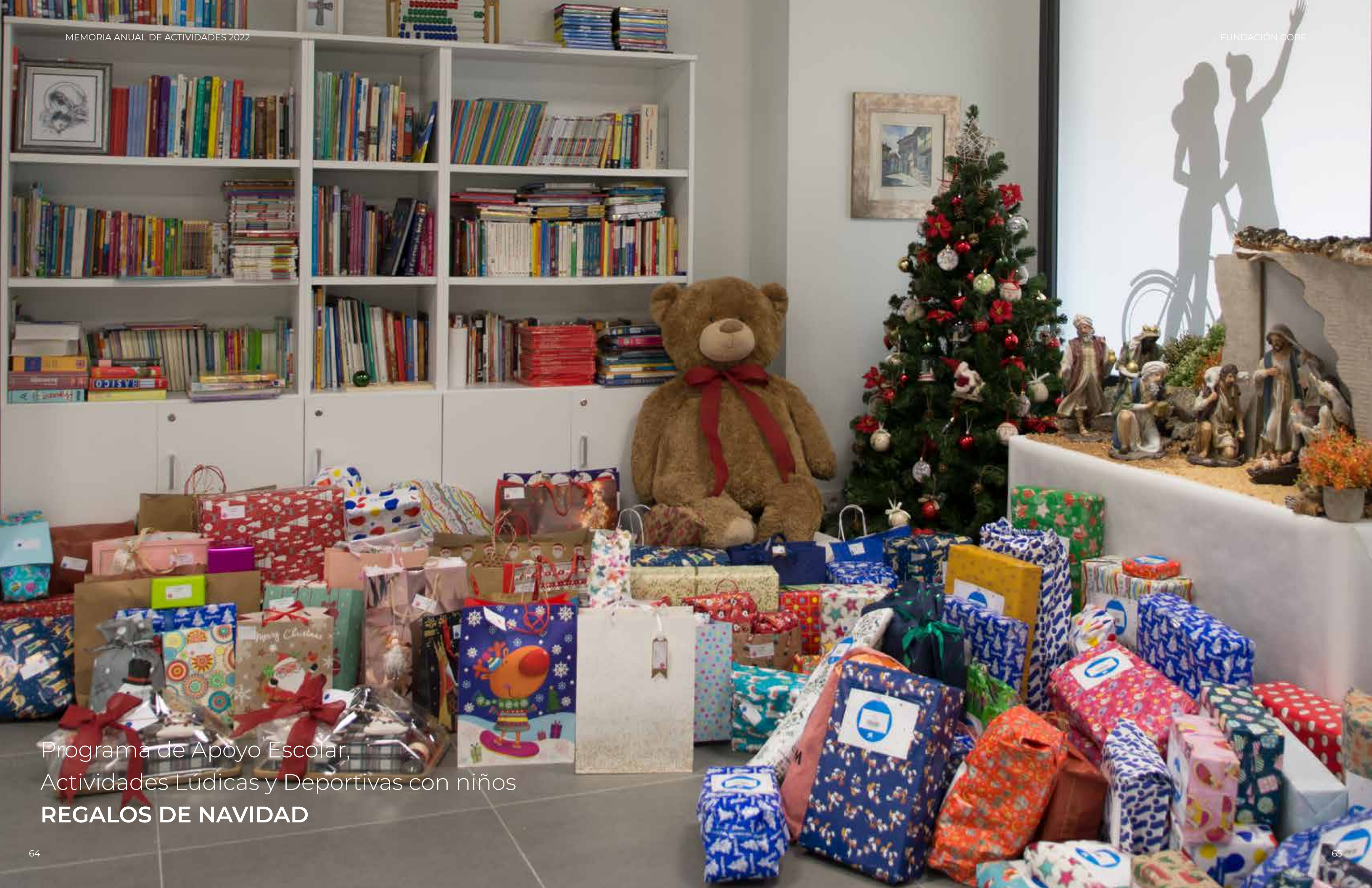
Programa de Apoyo Escolar, Actividades Lúdicas y Deportivas con niños REGALOS DE NAVIDAD