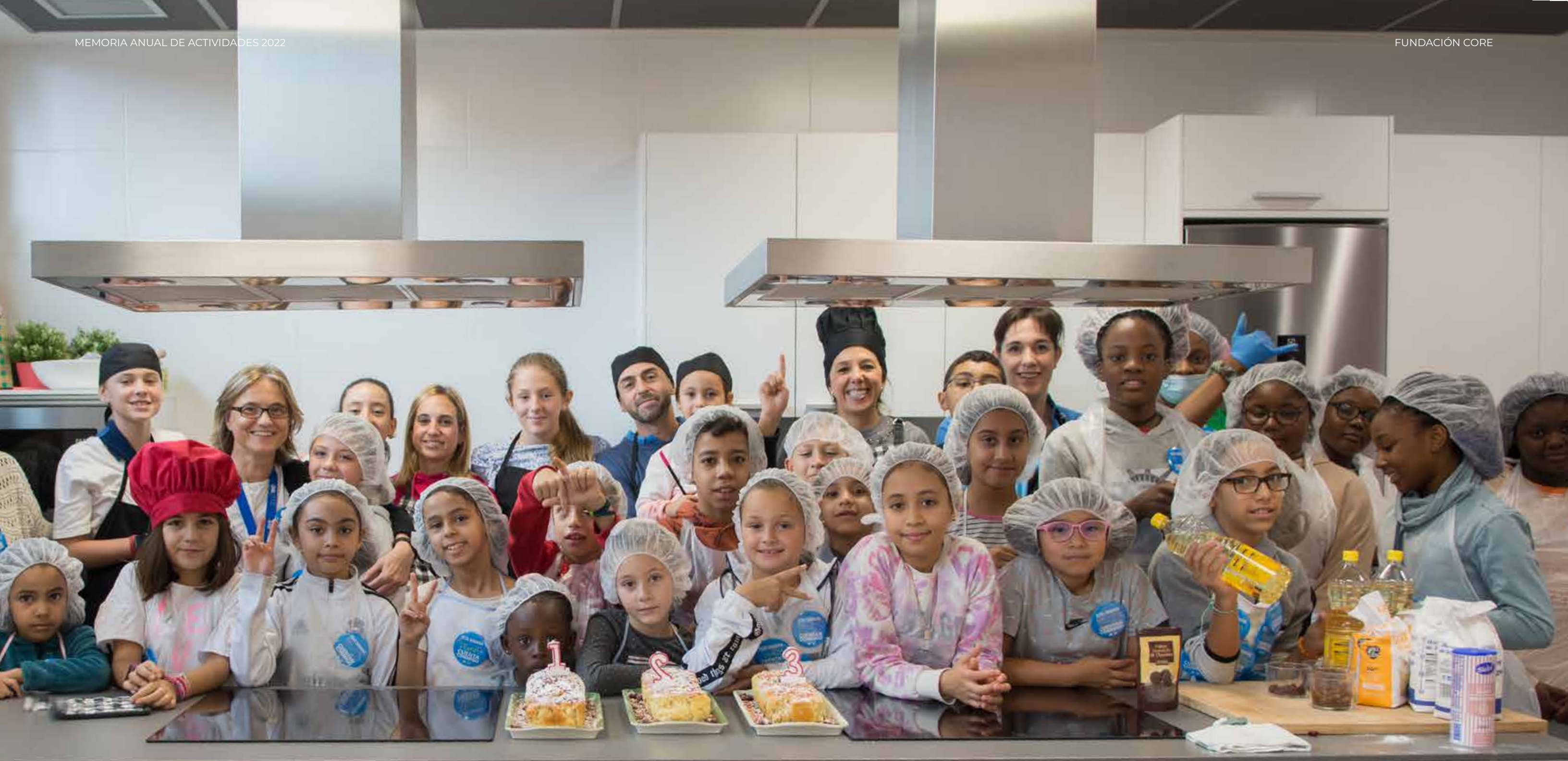
Programa de Apoyo Escolar, Actividades Lúdicas y Deportivas con niños CONCURSO CULINARIO